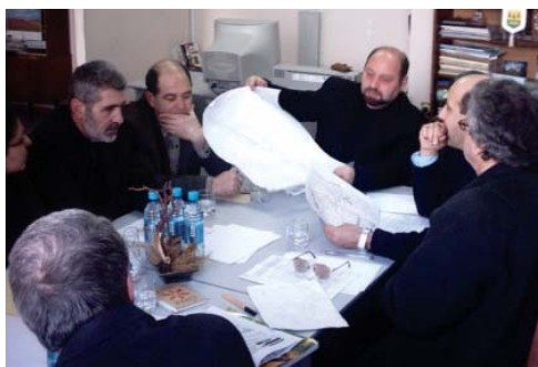
Консультации между властями в заинтересованных странах - ключевые для трансграничной EIA.

Некоторые специфические примеры экологических преимуществ, возникающих при применении Конвенции включают: